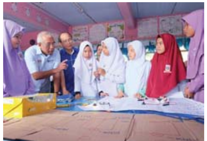
Kementerian menasarkankan untuk memastikan semua murid celik huruf dan angka.

Selain itu, pembangunan hab bersepadu ECCE di Kota Kemuning oleh SEGi Education Group akan membantu menyediakan khidmat pendidikan dan latihan yang diperlukan oleh golongan profesional ECCE. Pembangunan hab tersebut kini sedang dijalankan selepas mendapat kelulusan daripada Unit Kerjasama Awam Swasta (UKAS) pada tahun 2017.