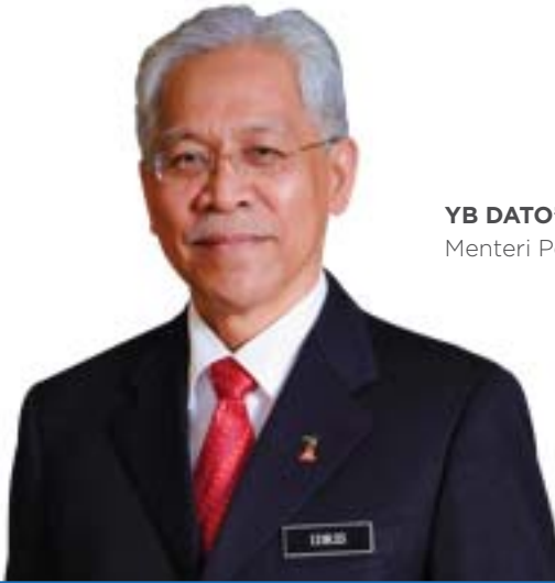
YB DATO' SERI HAJI IDRIS JUSOH