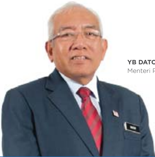
YB DATO' SERI MAHDZIR KHALID Menteri Pendidikan

Di bawah NTP, keberhasilan murid perlu dipertingkatkan agar anak-anak kita mampu bersaing pada peringkat global dan menyumbang kepada pertumbuhan ekonomi negara. Oleh itu, Kementerian telah memberi penekanan kepada inisiatif-inisiatif untuk meningkatkan kualiti sistem pendidikan negara sejak tahun 2010 dan ini telah mengubah budaya kerja ke arah budaya yang berorientasikan prestasi dalam pengajaran dan pembelajaran. Situasi ini berbeza sebelum inisiatif NTP Pendidikan diperkenalkan pada tahun 2009, di mana prestasi murid Malaysia agak ketinggalan berbanding negara-negara lain di rantau ASEAN berdasarkan Trends in International Mathematics and Science Study (TIMSS) dan Programme for International Student Assessment (PISA).