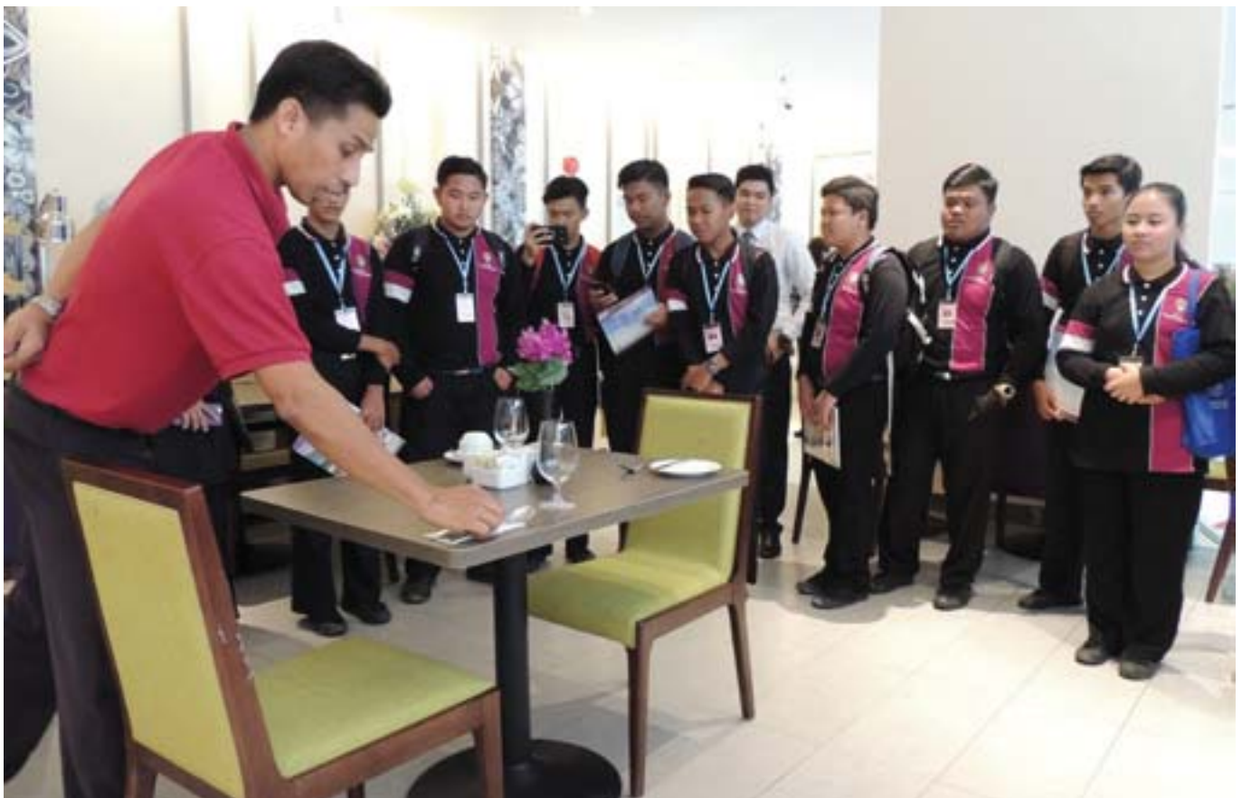
Demonstrasi penyediaan meja makan oleh Mercure Kota Kinabalu kepada pelajar Ascot Academy.

KSM juga telah mengambil langkah-langkah bagi meningkatkan tahap TVET, iaitu dengan menetapkan sekurang-kurangnya 30% daripada keseluruhan pengambilan pelajar di semua institut latihan kemahiran awam melaksanakan latihan secara Sistem Latihan Dual Nasional (SLDN), menetapkan agar badan yang diterajui industri mewajibkan syarikat/ahli mereka menjadi penyedia latihan SLDN dan meningkatkan insentif kewangan bagi perantis dari RM300 ke RM500 untuk meningkatkan jumlah pelajar yang dilatih di bawah SLDN.