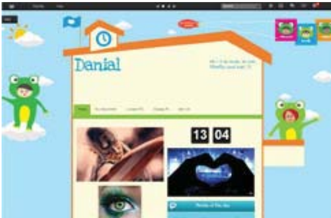
Frog VLE menyokong pembelajaran abad ke-21 di sekolah.

Kementerian akan menghasilkan lebih banyak kandungan pembelajaran untuk menggalakkan lebih ramai murid menggunakan platform Frog VLE. Kementerian juga sedang mengkaji kebolehlaksanaan polisi dan garis panduan yang membenarkan murid-murid membawa peralatan mudah alih ke sekolah untuk meningkatkan penggunaan VLE.