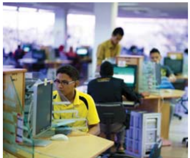
Kerajaan bekerjasama dengan IPT untuk meneraju kluster-kluster disiplin pendidikan.

Kursus pengajian selama enam bulan telah dijalankan dari bulan Januari ke Jun 2017 oleh Sunway TES CAE dan 18 orang pelajar dari tujuh politeknik telah dipilih untuk menyertai program khas ini sebagai persediaan menghadapi peperiksaan akhir pada bulan Jun 2017. Susulan kursus pembelajaran tersebut, kadar lulus untuk ujian F5 dan F6 masing-masing sebanyak 1% dan 41%, di mana seorang pelajar tidak menduduki peperiksaan akhir. Cabaran-cabaran yang dikenal pasti oleh pensyarah sebagai penyebab utama keputusan suboptimum ini termasuklah disiplin yang rendah dalam kalangan pelajar dan kemahiran bahasa yang lemah. Berikutan itu, sebuah Program TTT telah dijalankan dari 4 hingga 8 Ogos 2017 untuk 10 orang pensyarah daripada Politeknik Port Dickson mengenai sukatan pelajaran F5 dan F6.