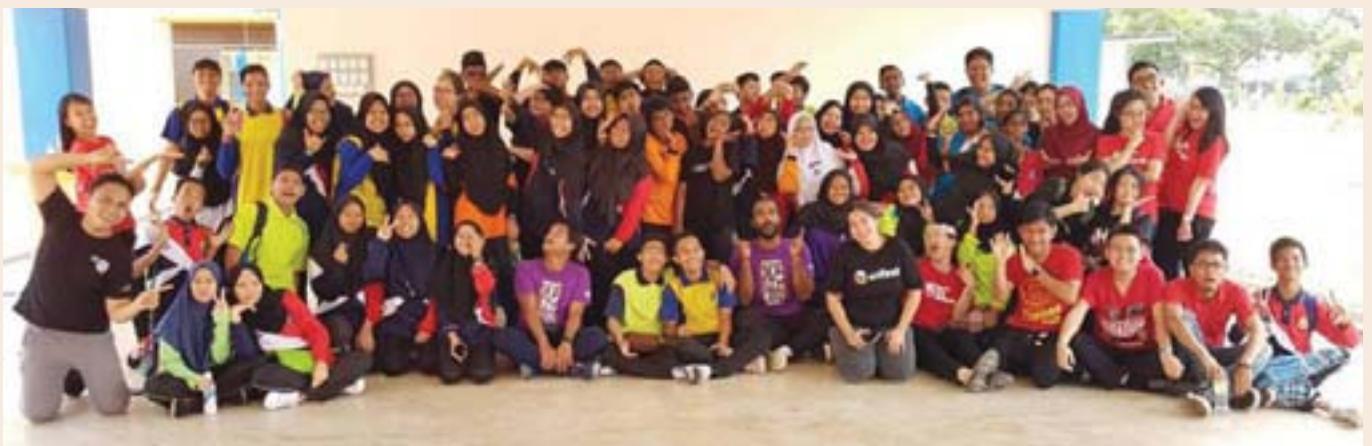
Murid-murid mengambil bahagian dalam program-program yang dijalankan oleh Enfiniti Academy of Musical Theatre & Performing Arts.