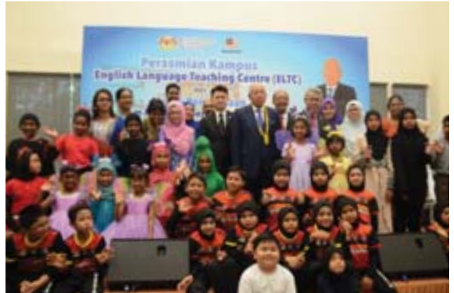
YB Dato' Seri Mahdzir Khalid telah merasmikan kampus ELTC yang baharu dan Persidangan HIP yang kedua pada 14 Ogos 2017.

Sebagai sebahagian daripada usaha memupuk rakyat Malaysia yang berdaya saing pada peringkat global melalui peningkatan penguasaan Bahasa Inggeris, Kerajaan telah memperkenalkan Program Dwibahasa (DLP) pada tahun 2016. DLP bermula dengan sebuah projek rintis yang melibatkan murid-murid Tahun 1, Tahun 4 dan Tingkatan 1 di 378 buah sekolah. Program tersebut telah diperluaskan ke 836 buah sekolah lagi pada tahun 2017 menjadikan bilangan sekolah yang melaksanakan DLP sebanyak 1,214 buah sekolah (585 buah sekolah rendah dan 629 sekolah menengah). Sehingga kini, sejumlah 129,859