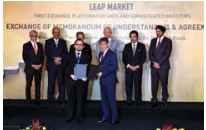
Pertukaran MoU dan perjanjian LEAP Market pada 25 Julai 2017.

peluang untuk pengurus aktif membuat keputusan berdasarkan maklumat dalam sektor tersebut. Bursa Malaysia berhasrat untuk mengembangkan lagi dua segmen ekuiti baharu ini dan terus memacu kemampuan dalam pasaran dengan membawa produk baharu yang boleh dilabur dalam pasaran.