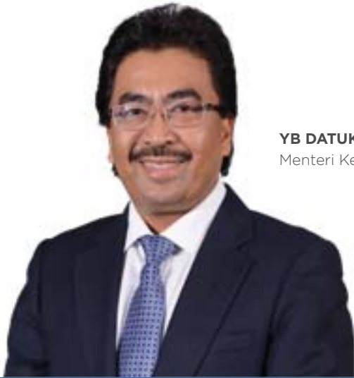
YB DATUK SERI JOHARI ABDUL GHANI Menteri Kewangan II

NKEA Perkhidmatan Kewangan telah mencapai kemajuan ketara dalam membangunkan industri kewangan Malaysia dan meningkatkan daya saingnya di rantau ini sejajar dengan keperluan sistem kewangan bagi sebuah negara berpendapatan tinggi. Kemajuan ini dicapai dengan panduan para pengawal selia serta usaha yang didorong pasaran. Kerajaan juga telah menggariskan tiga bidang strategik untuk memperkukuhkan ekonomi Malaysia di samping memacu pertumbuhan ekonomi yang inklusif dan mampan untuk masa hadapan. Ini termasuk memastikan pertumbuhan dan perkembangan ekonomi yang sama rata untuk memberi peluang kepada mereka yang berada di pekan dan kawasan luar bandar; menjadikan Malaysia sebuah pasaran yang berdaya saing dalam ekonomi digital; serta memanfaatkan teknologi kewangan sebagai pemboleh untuk memperkukuhkan ketahanan dan kemampuan sistem kewangan.